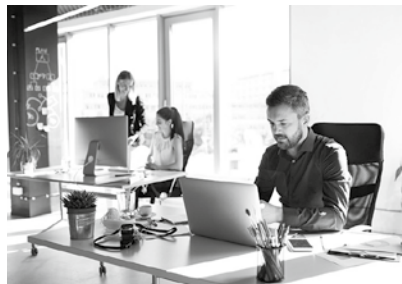
employé de bureaux (banque, assurance...)