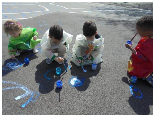
Fresques et traces