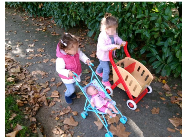
Promenade des nounous