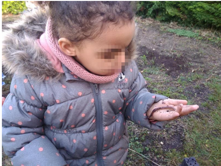
Observer le monde animal