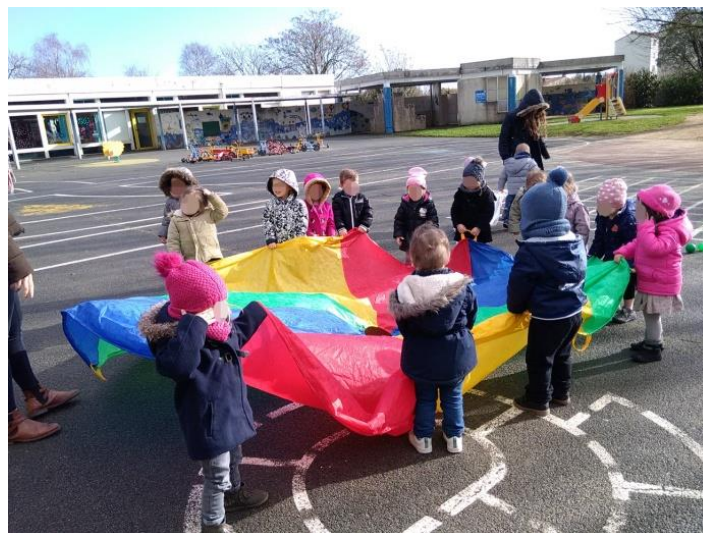
Rondes et jeux dansés