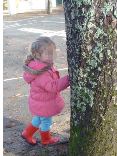
Les 5 sens