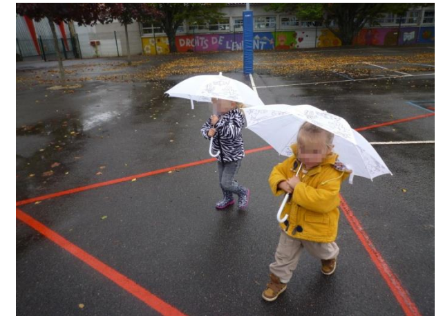
Sortir sous la pluie, parapluie