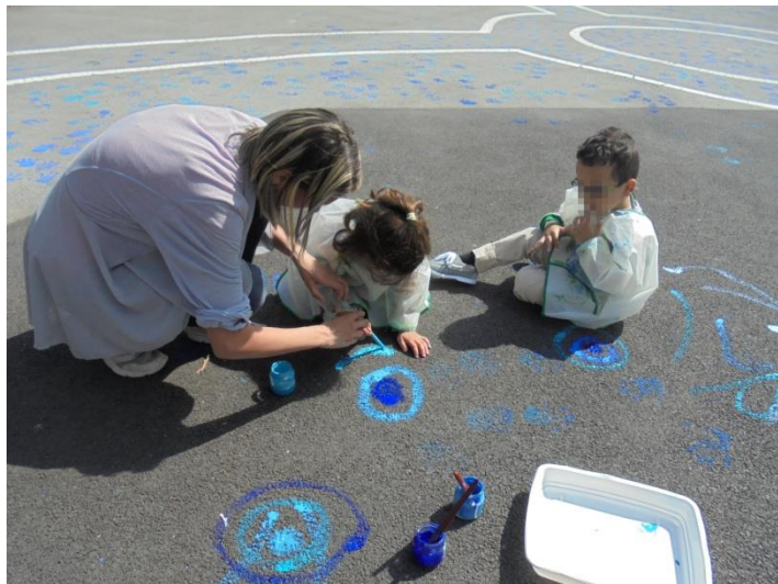
Laisser des traces au sol