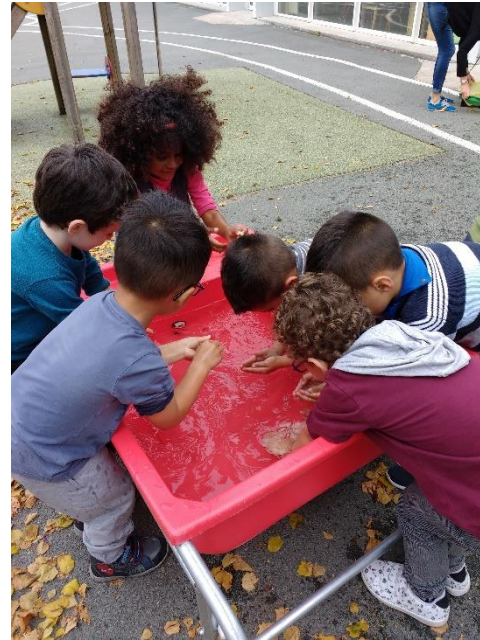
Transporter remplir vider eau/sable