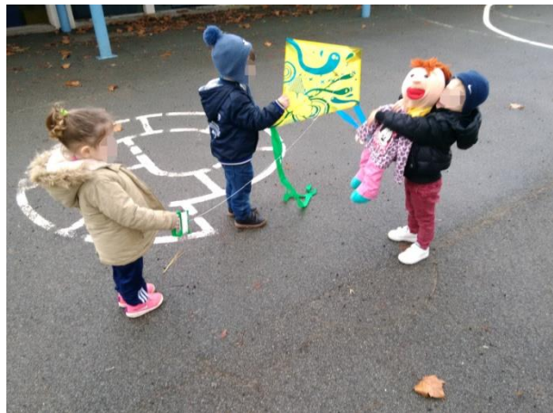
L'air (cerf volant)