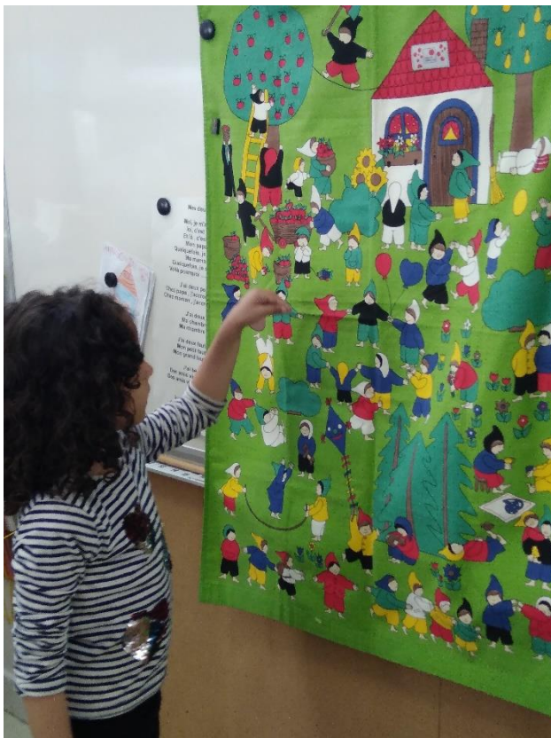
Retrouver et nommer les couleurs demandées en polonais avec un parent polonais