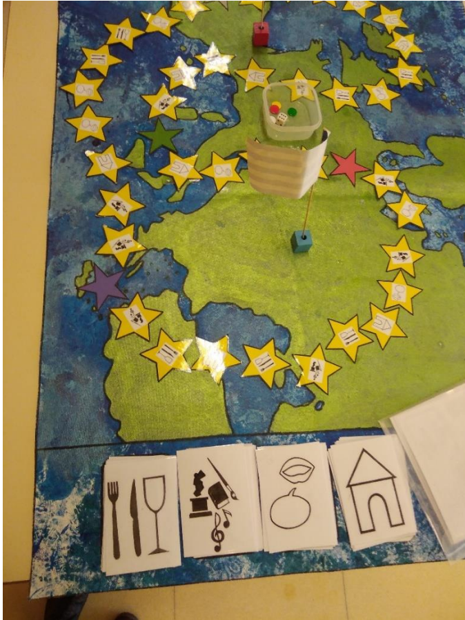
Jeu créé par les élèves d'Aulnay de Saintonge dans le cadre de leur projet Erasmus+ avec la Crête et la Pologne