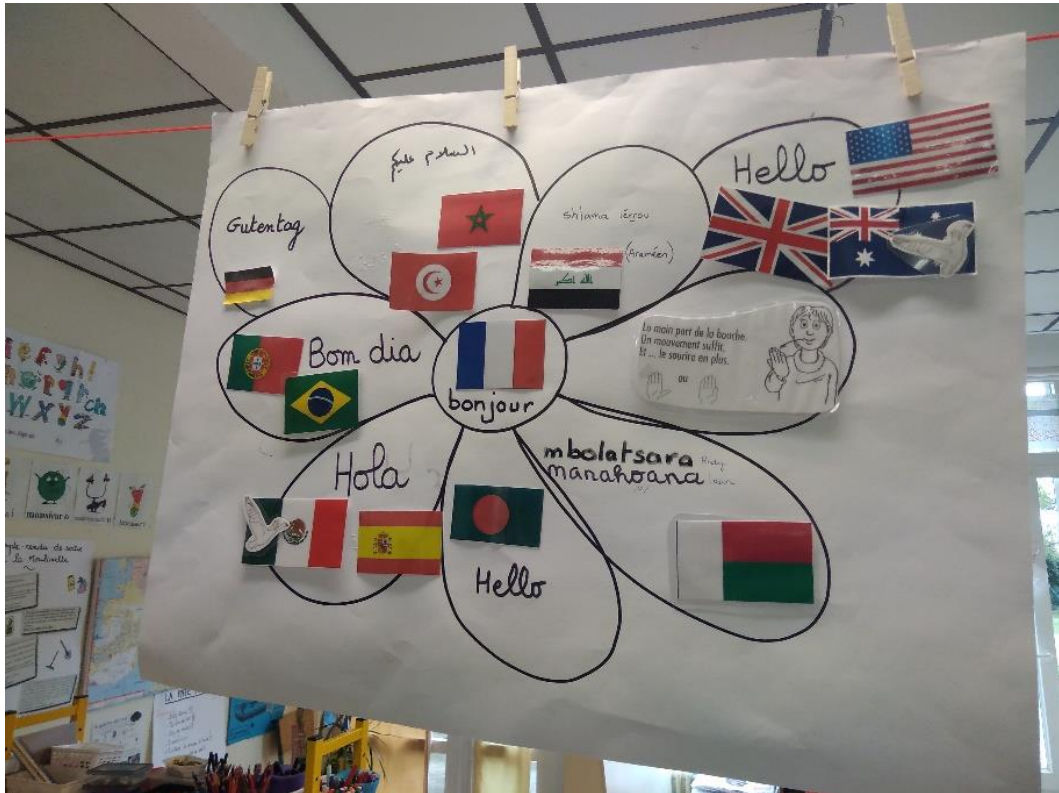
Se dire bonjour dans les langues des familles et autres langues- école maternelle Jean Bart