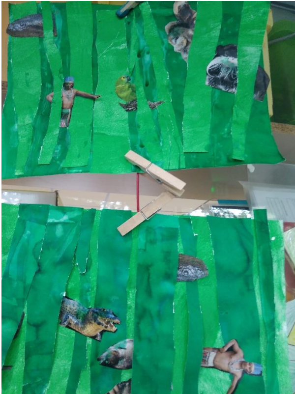
Production dans le cadre de la destination Brésil du projet « le voyage de Piron »