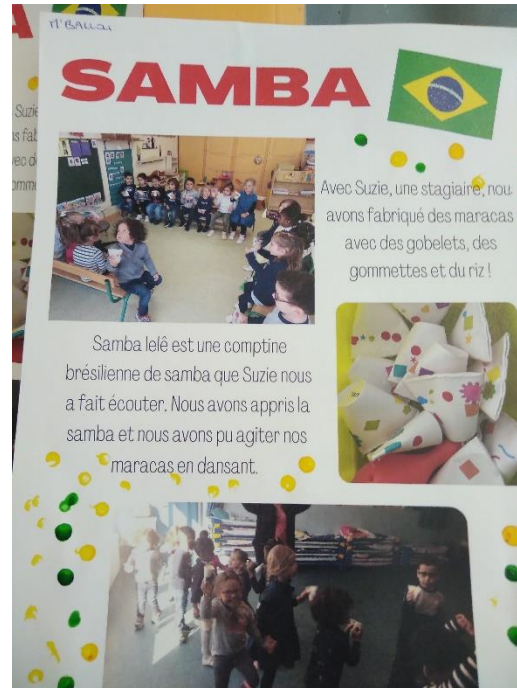
Découverte de la Salsa à La Genette et de la Samba à Jean Bart

➤ Développer le langage oral et consolider la maîtrise du français :