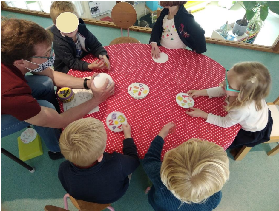
Jeu de reconnaissance des formes et couleurs en anglais avec un parent anglophone, école La Genette maternelle