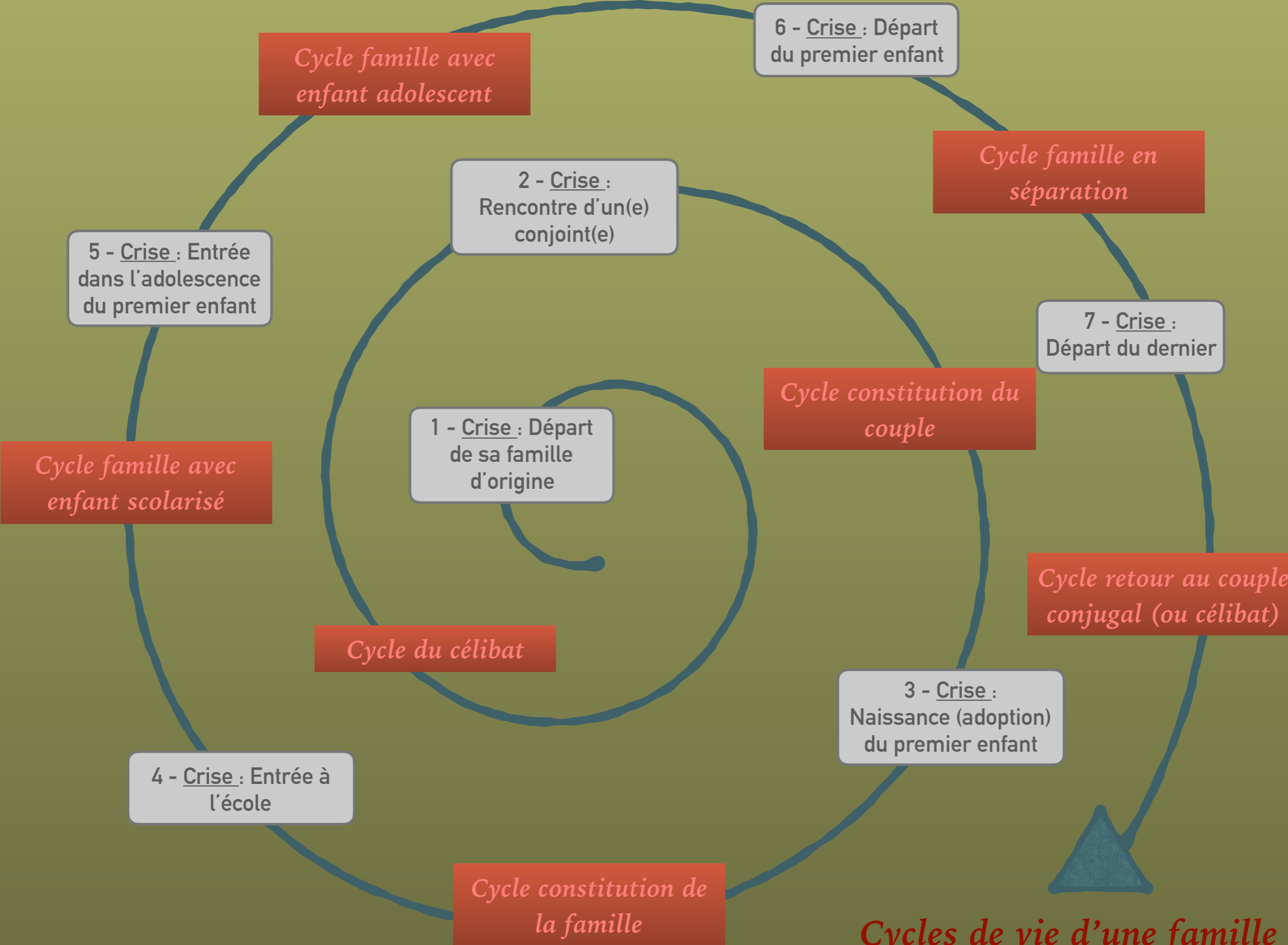
Cycles de vie d'une famille