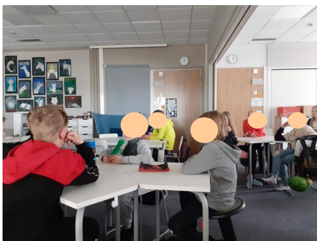
Cloison dépliée pour un plus grand espace