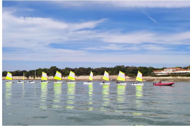
Session de voile sur les optimistes – septembre 2023 – Classe de CM1