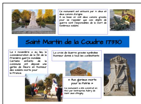
Exemples de productions réalisés par les élèves.