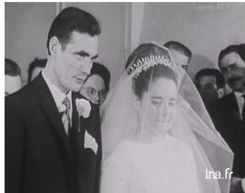
Indépendance financière (Edu01802)