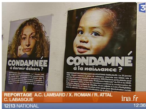
La Halde contre les discriminations (Edu04495)