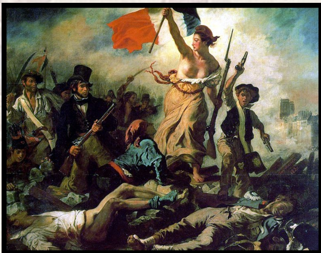
La Liberté guidant le peuple