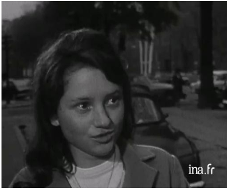
Mixité à l'école (doc Edu01801)