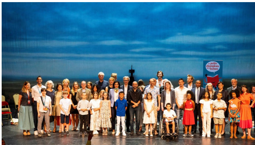
Finale nationale de la 11e édition à la Comédie-Française

Inscrire votre classe offre à vos élèves l'opportunité de développer leur goût pour la lecture et leur confiance en eux , des compétences essentielles pour leur avenir.