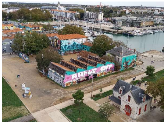
Friche du Gabut © Bruno Loret