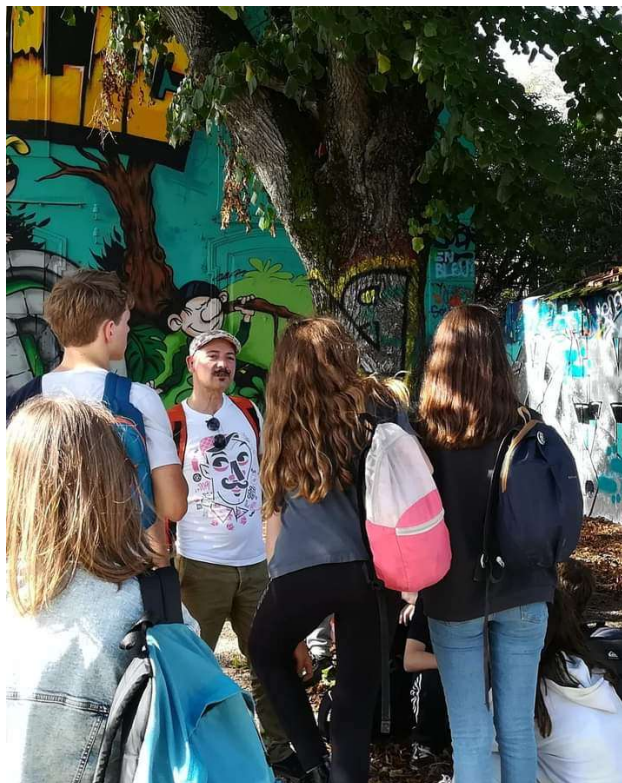
Balade urbaine scolaire

Tarifs et réservations sur demande auprès de Lexa Bitrin, LEXA&CO - lexa@lexa-and-co.com