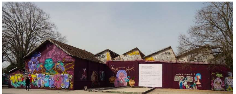
Graffiti Jam Ladies in the West 2022

Rendez-vous devant l'Office de de Tourisme de La Rochelle