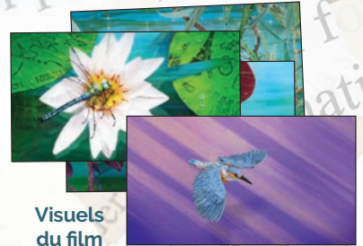
Visuels du film