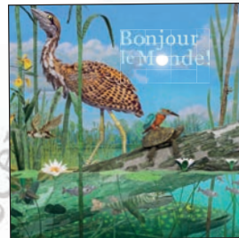
Dossier de presse

Affiche 120 x 160 cm Affiche 40 x 40 cm en vente chez Sonis