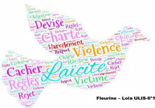
Fleurine - Lola ULIS-6 1