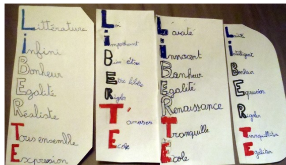
Rognaix - CM1-CM2

Classe de CM1 de l'école Louis pasteur (Albertville)