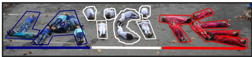
Mercury - le Villard, CM1-CM2