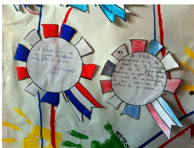
Alberville - Champ de Mars - CE2-CM1